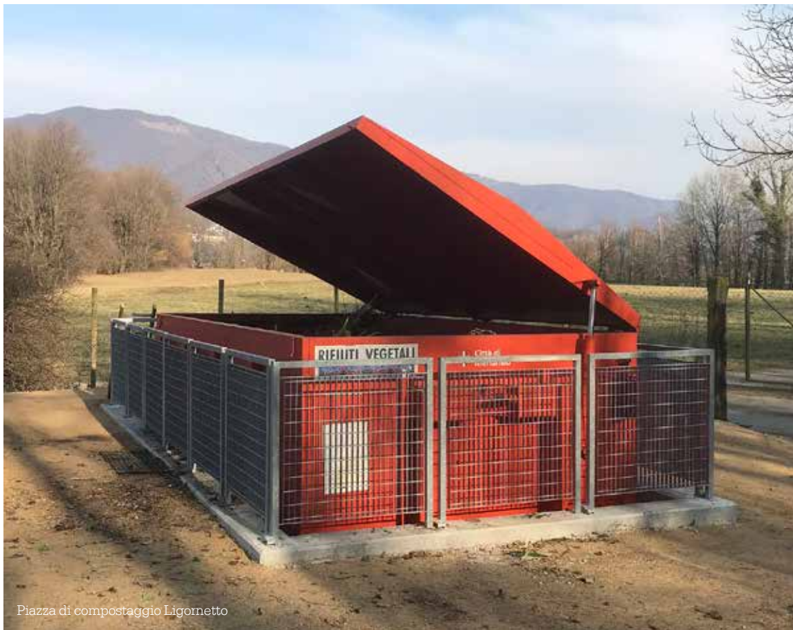
Piazza di compostaggio Ligometto