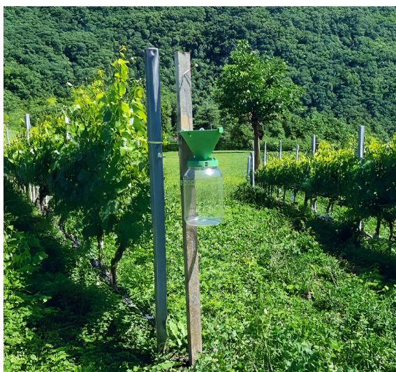
Posizionamento scorretto di una trappola a feromoni.