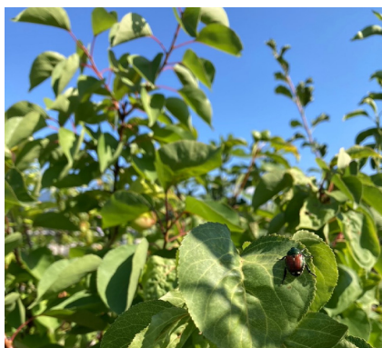
Ispezionare le piante.