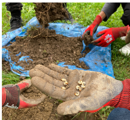
Ispezionare la terra.