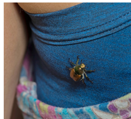
Controllare vestiti e macchinari.