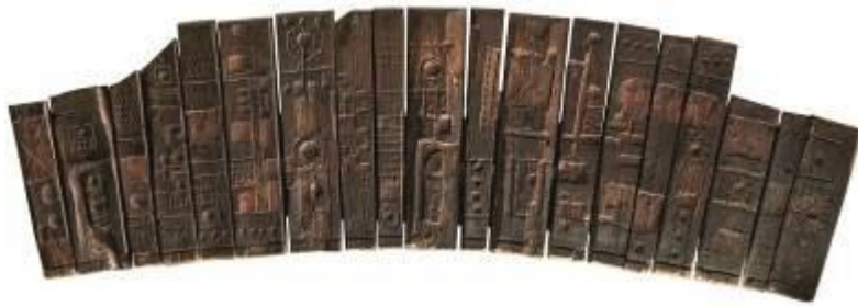
4. Mappa di Niardo (n.3) anni Sessanta tavole, frammenti e scarti lignei, fili di ferro 52 x 178 x 4 cm Collezione privata