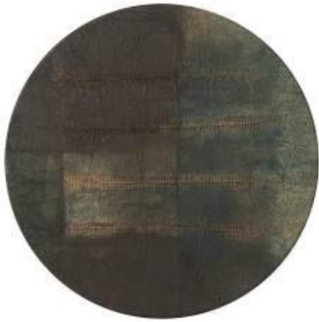
22. Tondo 2000 legno, carta trattata colorata, chiodi Ø 90 cm Archivio Franca Ghitti, Cellatica