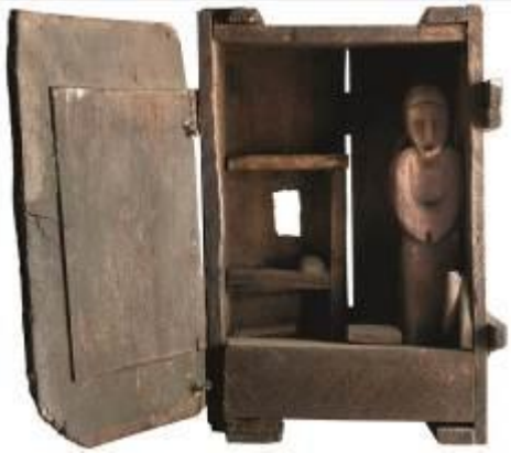
10. L'abitacolo dell'eremita 1976 legno, fili di ferro 47 x 35 x 20 cm Archivio Franca Ghitti, Cellatica