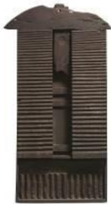
25. Edicola 1987 legno 135 x 73 x 13 cm Archivio Franca Ghitti, Cellatica