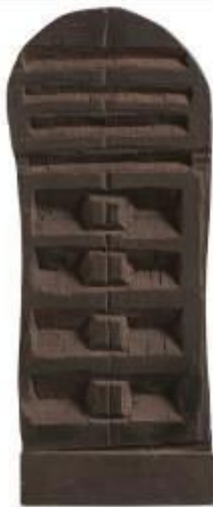
29. Libro chiuso s.d. legno, colore 54 x 21 x 13 cm Archivio Franca Ghitti, Cellatica