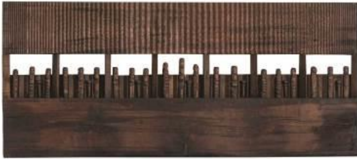
16. Vicinia s.d. legno, chiodi 81 x 187 x 10 cm Archivio Franca Ghitti, Cellatica