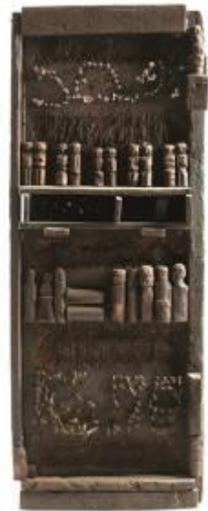
15. Valle dei Magli 1975