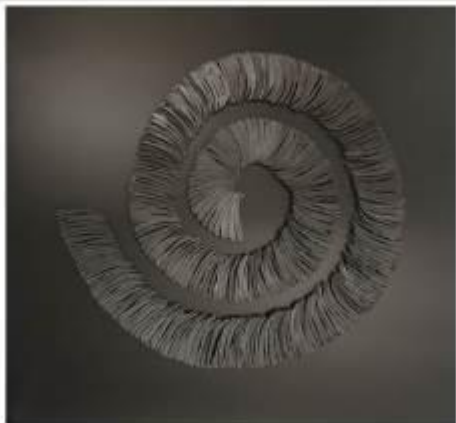
19. Spirale fine anni Ottanta scarti di ferro saldati Ø 146 cm Archivio Franca Ghitti, Cellatica Foto Stefano Spinelli