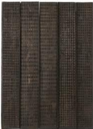
32. Grande mappa: lunario 1988 legno, ferro 198 x 144 x 8 cm Archivio Franca Ghitti, Cellatica