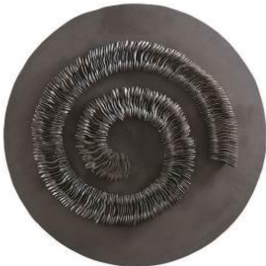
18. Spirale 2011 ferro Ø 122 cm Archivio Franca Ghitti, Cellatica Foto Stefano Spinelli