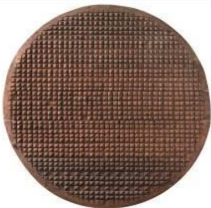
20. Tondo s.d. legno, colore Ø 109 cm Archivio Franca Ghitti, Cellatica Foto Stefano Spinelli