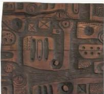
3. Mappa anni Sessanta legno 86 x 93 x 4 cm Archivio Franca Ghitti, Cellatica