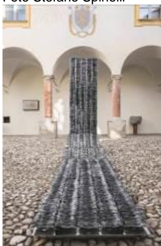
35. Cascata 1995 installazione scarti di ferro Archivio Franca Ghitti, Cellatica Foto Stefano Spinelli