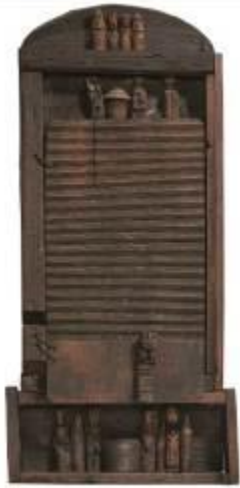
28.a Madia legno, fili di ferro 95 x 45 x 15 cm Archivio Franca Ghitti, Cellatica