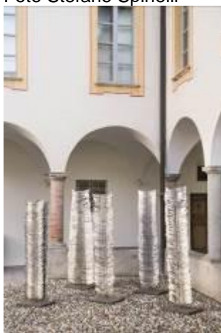
34. Alberi – Vele 2000 installazione con 10 elementi scarti di ferro Archivio Franca Ghitti, Cellatica Foto Stefano Spinelli