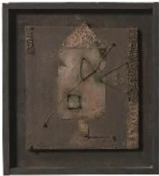
31. Mappa di misurazione 1976 legno, chiodi, rame, ferro 35 x 41 x 5 cm Archivio Franca Ghitti, Cellatica