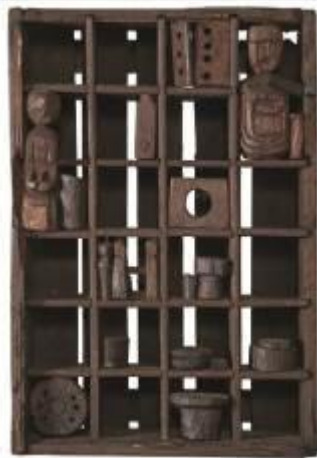
12. Vicinia 1 1974 legno, chiodi 45 x 30 x 11 cm Archivio Franca Ghitti, Cellatica Foto Stefano Spinelli