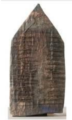
30. Vicina s.d. legno, carta, chiodi 51 x 25 x 3 cm Archivio Franca Ghitti, Cellatica