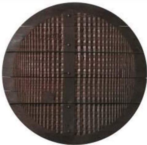
24. Tondo s.d. legno, colore Ø 157 cm Archivio Franca Ghitti, Cellatica Foto Stefano Spinelli