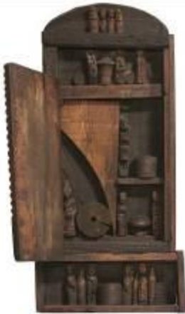
28.b Madia legno, fili di ferro 95 x 45 x 15 cm Archivio Franca Ghitti, Cellatica