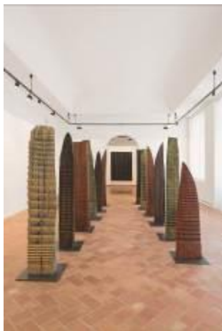
33. Bosco s.d. installazione con 12 alberi legno, ferro, colore Archivio Franca Ghitti, Cellatica