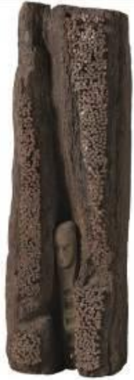
13. Senza titolo s.d.