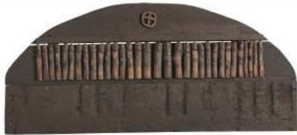
14. Litania 2 1976

Archivio Franca Ghitti, Cellatica Foto Stefano Spinelli