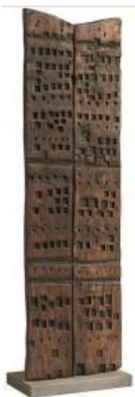
5. Porta del silenzio 1981 legno 173 x 51 x 8 cm Archivio Franca Ghitti, Cellatica