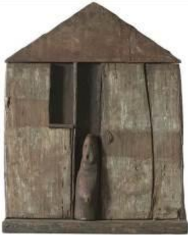
11. Vicinia s.d. legno, colore, latta, chiodi 57 x 46 x 8 cm Archivio Franca Ghitti, Cellatica Foto Stefano Spinelli