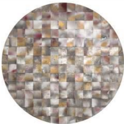
21. Tondo s.d. legno, lamiera, colore Ø 121 cm Archivio Franca Ghitti, Cellatica Foto Stefano Spinelli