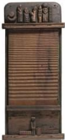
27. Edicola 1986 legno, chiodi 100 x 44 x 17 cm Archivio Franca Ghitti, Cellatica