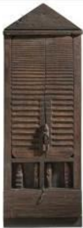
26. Edicola 1986 Legno, cuoio, chiodi, ferro 116 x 40 x 11 cm Archivio Franca Ghitti, Cellatica Foto Stefano Spinelli