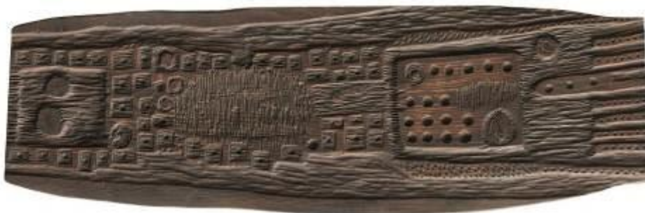
1. Mappa (Pagina dell'albero) 1979 legno 50 x 158 x 2 cm Archivio Franca Ghitti, Cellatica